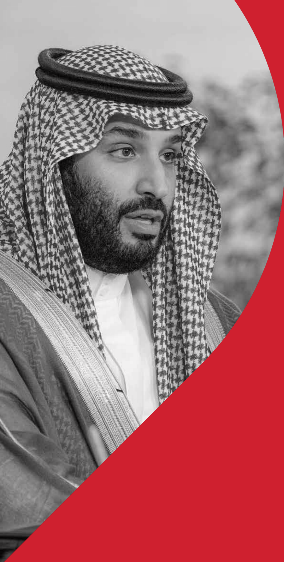
ولي العهد الأمير محمد بن سلمان آل سعود