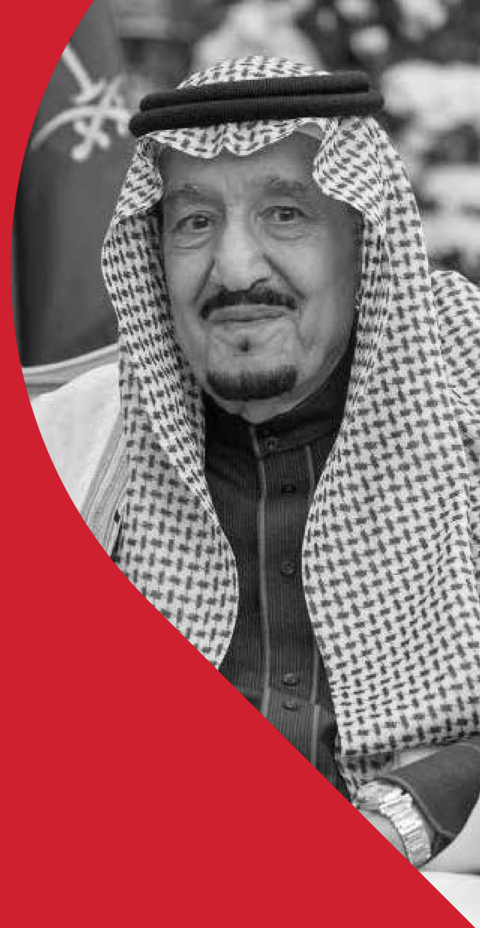
خادم الحرمين الشريفين الملك سلمان بن عبد العزيز آل سعود